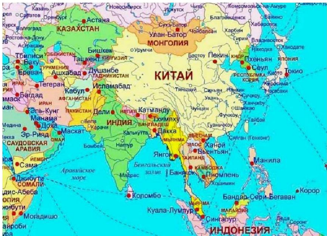
Политическая карта азиатского региона